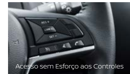
Acesso sem Esforço aos Controles

A Navara maximiza o armazenamento interno e externo. Os bancos traseiros dispõem de armazenamento seguro debaixo do assento e ostentam a capacidade de permanecer convenientemente virados para cima para ajudar a transportar artigos mais altos.