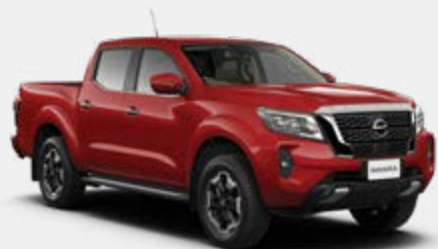
Vermelho (S) - AX6