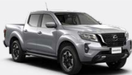
Prata (M) -Y0