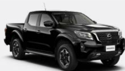
Preto Infinito (S) - KH3