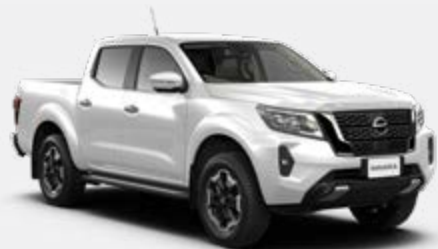
Branco (S) -QM1