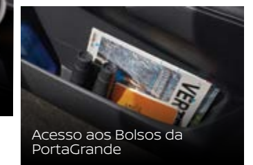
Acesso aos Bolsos da PortaGrande