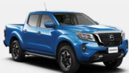
Azul (M) - B16