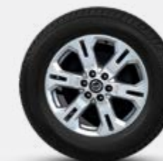
17" DE LIGA