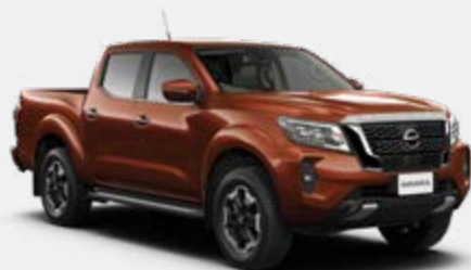
Cobre Forjado (M) - CAU