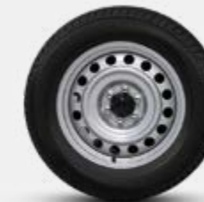
16" AÇO (CABINE ÚNICA)