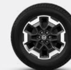
18" DE LIGA (Classe LE Plus)