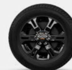
17" DE LIGA (PRO-4X)

O compromisso de qualidade da Nissan : Para proporcionar a todos os clientes um nível consistentemente elevado de qualidade, a Nissan aplica os mesmos padrões a nível mundial, para assegurar que todos os proprietários da Nissan desfrutem de paz de espírito para a vida dos seus veículos. A abordagem baseia-se na qualidade, na perspectiva do cliente, em três elementos fundamentais : Em primeiro lugar, a expectativa de uma experiência de condução suave com total tranquilidade de espírito. Em segundo lugar, o apelo intangível de um veículo, o seu poder de captivar e excitar, com características que captam a atenção e a imaginação. Terceiro, o nível de atenção e serviço durante o processo de venda, e muito depois da venda estar concluída.