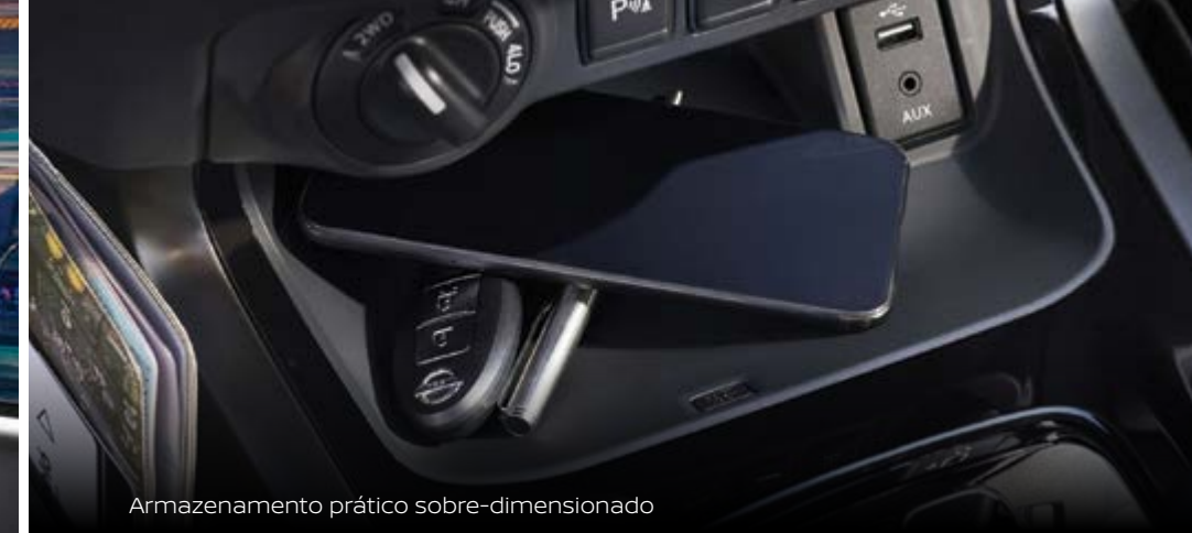
Armazenamento prático sobre-dimensionado

A forma encontra a função ao descobrir como a cabine Navara foi cuidadosamente planeada para se integrar perfeitamente em cada momento; seja para trabalhar, brincar ou lazer. As áreas de armazenamento, a consola de óculos de sol, um porta-luvas sobredimensionado e múltiplos pontos de carregamento fazem da novíssima Navara a companhia perfeita para a vida quotidiana.