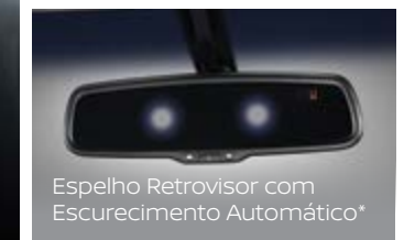
Espelho Retrovisor com Escurecimento Automático*