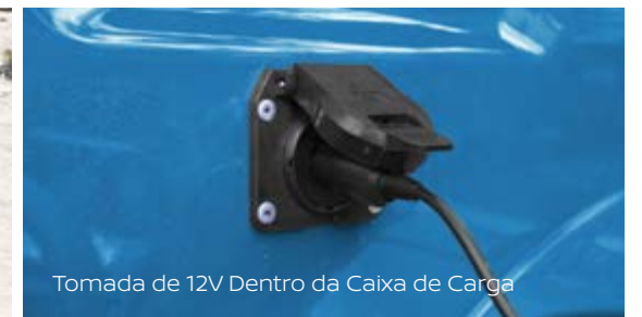
Tomada de 12V Dentro da Caixa de Carga