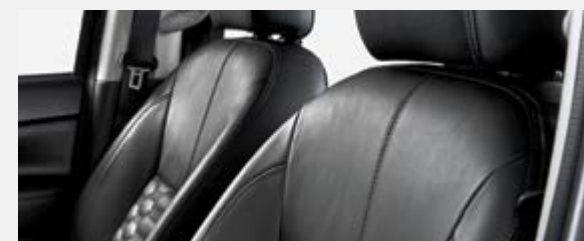
ASSENTOS DE CABEDAL PRETO (Modelo LE Plus)