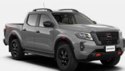
Cinzeno Guerreiro (PM) - KBY Disponível apenas em PRO-4X