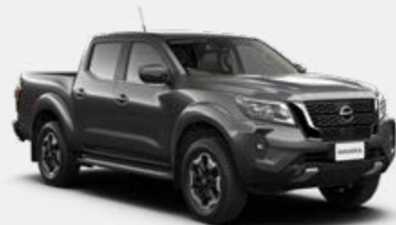
Cinzeno Techno (M)- KY5