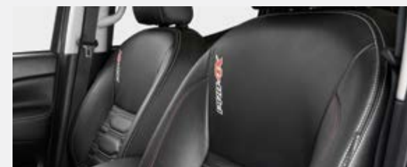
ASSENTOS DE CABEDAL PRETO (Modelo PRO-4X)